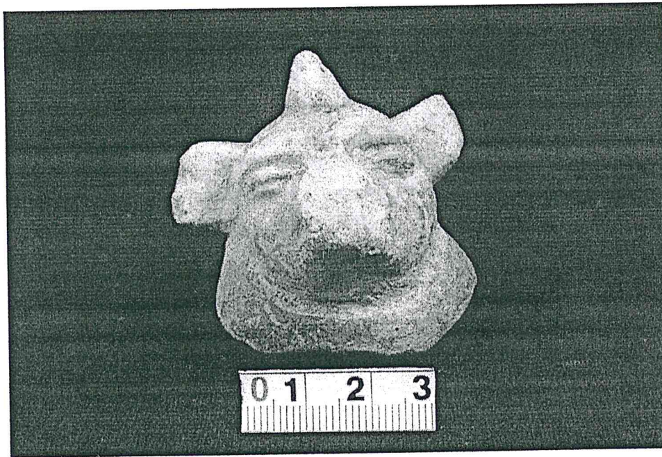
Figura 4. Cabeza Zoomorfa fragmentada de una Ocarina con la representación de un Perro Maya, Periodo Clásico Tardío (PANTA 2019).

El programa permanente de estudios de los materiales cerámicos de Tak'alik Ab'aj, ha sido una herramienta clave para responder a preguntas fundamentales en arqueología como ¿Qué función tuvo cada artefacto cerámico? ¿Para qué fue elaborada la representación en la cerámica? ¿Cuál es el periodo en que se elaboró la pieza cerámica? ¿La relación de la pieza cerámica con su contexto es directa o indirecta?, con las respuestas de estas preguntas nos podremos acercar más a la realidad de los pobladores prehispánicos y podremos entender la manera en que ellos vivieron su cultura, aprender de ella y poderla fechar con más precisión.