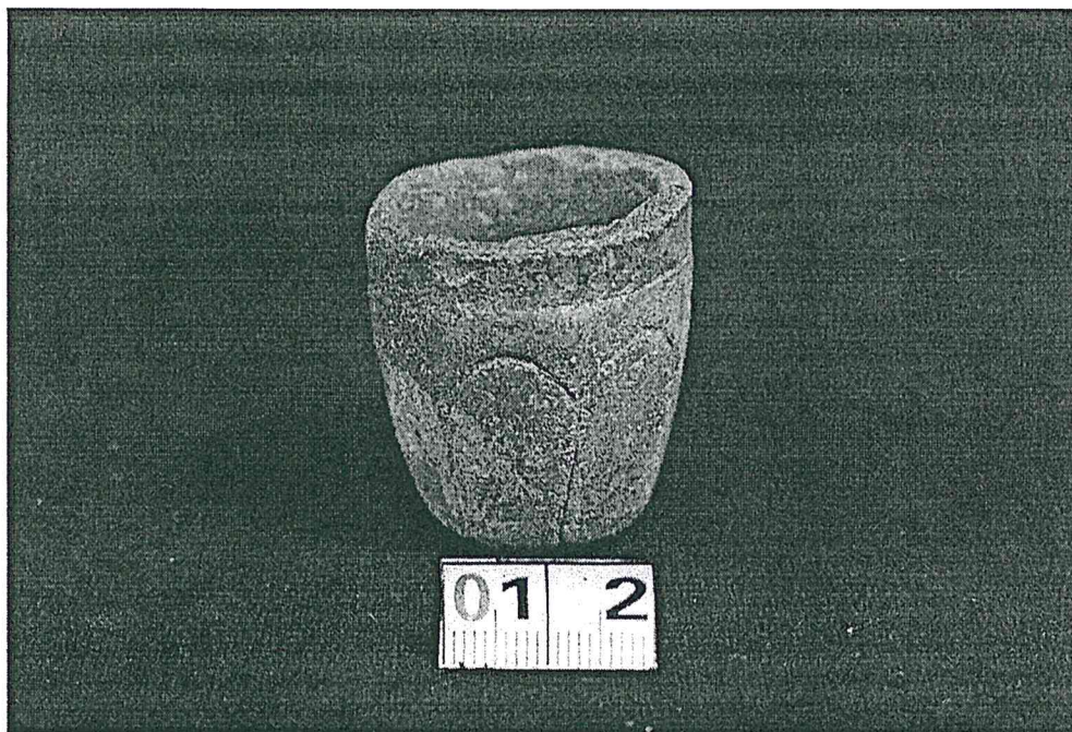
Figura 3. Vaso miniatura con forma de pétalos de flor como decoración con incisiones, Periodo Preclásico Medio (PANTA 2019).